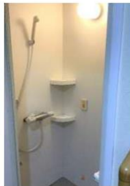
居室内シャワー室

同じ地域で、トイレ・洗面台・ミニキッチン・個室シャワー全てを完備したサ高住で、お二人同じお部屋に入居できるのは、ロボリハ・コート永寿だけです