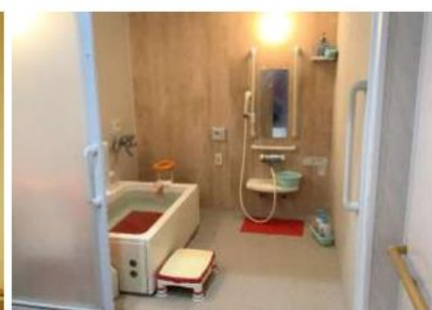
浴室（個浴・3方介助可）