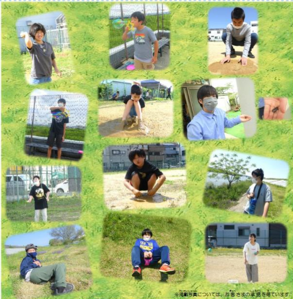
※掲載写真については、各々ご本人の同意を頂いています。

室内では、トランポリンやキーボード、カードゲームなど、一人ひとりが遊びたいこと、やってみたい活動をして楽しみました☆