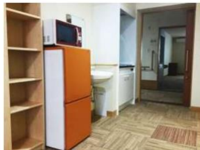
洗面台・ミニキッチン