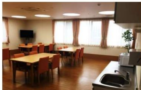
食堂・多目的ホール